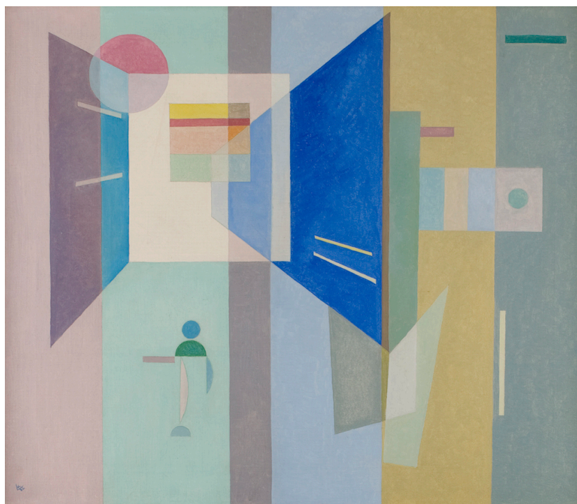
Wassily KANDINSKY, Nach Rechts – Nach Links (Vers la droite – vers la gauche) , 1932, huile sur toile, 60 x 70 cm