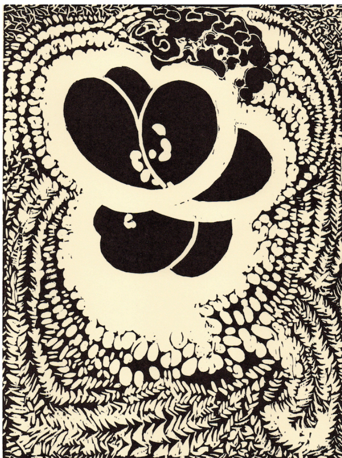
František KUPKA, Quatre histoires de blanc et noir , 1926, recueil de gravures sur bois, Paris, 1926, 33,5 x 25,8 cm

Peintre et graveur, Gallien est le plus ardent défenseur de la peinture non-figurative. Dans le secret de son atelier, il se livre à la recherche spirituelle et théorique d'une peinture exempte de toute figuration. Son œuvre, fondée sur le modèle hiérarchique de la franc-maçonnerie, apprentissage, compagnonnage et maîtrise, ira avec le temps jusqu'à supprimer la couleur, au profit des seuls noir et blanc, représentant pour lui « l'art aristocratique, suprême, absolu par excellence ». Il signe alors de l'anagramme de son nom : « Peintre-à-la-ligne-noire ».